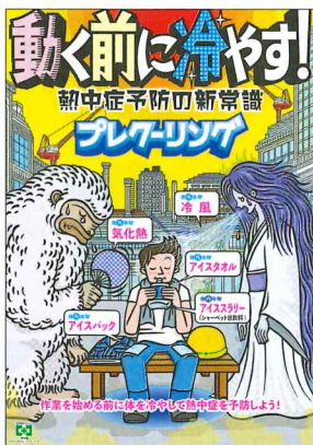
安全衛生ポスター 熱中症・プレクーリング No.31843 B2判 定価297円