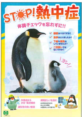
安全衛生ポスター STOP!熱中症 No.31813 B2判 定価297円