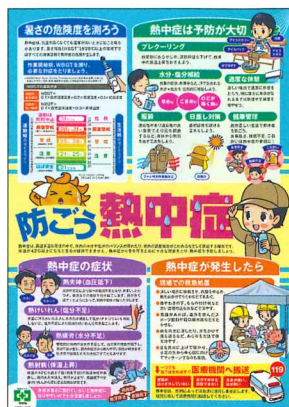
実践ポスター 防ごう熱中症 PP貼り No.31510 B2判 定価418円