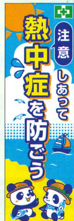
常時用のぼり 注意・熱中症 No.44896