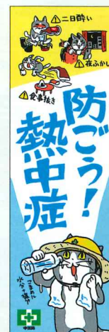
常時用のぼり 熱中症・仕事猫 No.44901 定価 2,970円 ●サイズ:H2.14×W0.7m ●材質:ポリエステル(フルカラー)