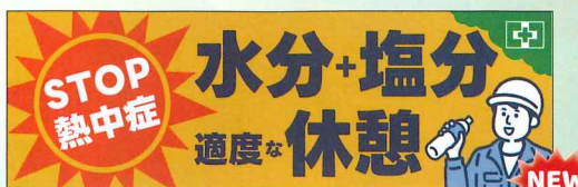
常時用横幕 STOP!熱中症 No.44913 定価 2,750円 ●サイズ:H0.7×W2.14m ●材質:綿