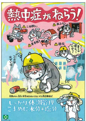
安全衛生ポスター 熱中症がねらう・仕事猫 No.31869 B2判 定価297円