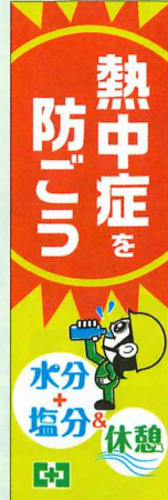
常時用のぼり 【蛍光・大型】熱中症 No.44885 定価 3,520円 ●サイズ:H2.7×W0.9m ●材質:綿 ●蛍光箇所:黄色