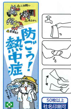
クールタオル(仕事猫) No.45055 定価 880円 ●サイズ:H900×W300mm ●材質:ポリエステル ●PP袋入