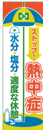
常時用のぼり ストップ!熱中症 No.44906 各定価 2,750円 ●サイズ:H2.14×W0.7m ●材質:綿